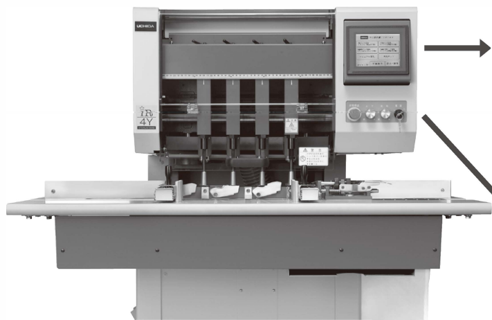
※写真はオプションのドリル回転インバーター付きのiR-4Yです。

新開発のマイコン制御により標準モデルの4連独立駆動ヘッドに加えて、新たに2連独立駆動ヘッドのモデルをラインナップしました。