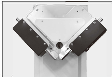
小サイズアタッチメント(オプション)