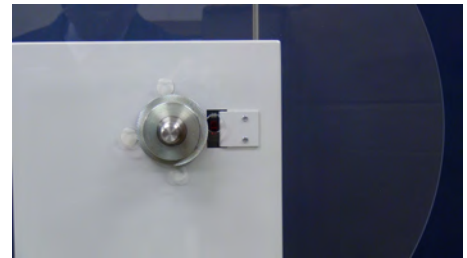
テープ残量センサー付き