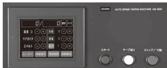
カラータッチパネル